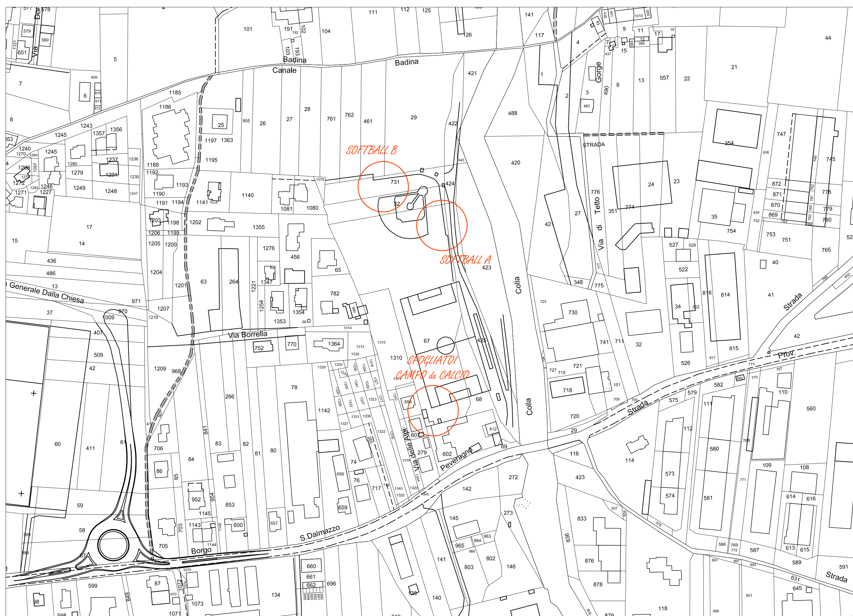
foglio 17 mapp. 2318